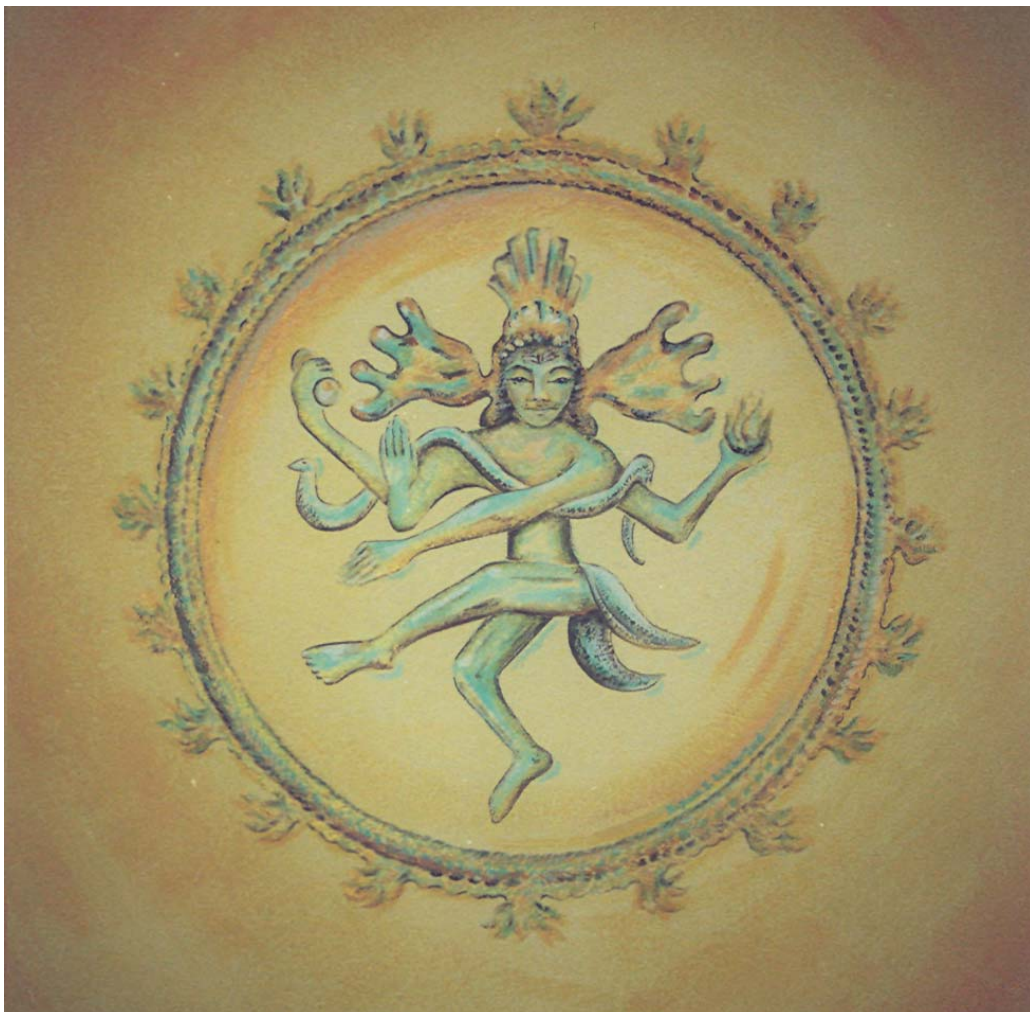
Der tanzende Siva

"Die göttliche Mutter hat mir im Kali-Tempel offenbart, dass sie jegliche Sache geworden sei. Sie hat mir gezeigt, dass jede Sache voller Bewusstheit ist - das Bild, der Altar, die Wassergefäße, die Schwelle, der Marmorboden - alles ist Bewusstheit. Ich habe jede Sache im Zimmer "in der vollen Glückseligkeit badend" vorgefunden - in der Glückseligkeit des Satchidananda. Ich habe einen bösen Mann vor dem Kali-Tempel gesehen, aber auch in ihm habe ich die Macht der göttlichen Mutter vibrieren sehen. Deshalb habe ich einer Katze Nahrung verfüttert, die für die göttliche Mutter bestimmt war..." (H. Zimmer, Philosophie und Religion Indiens , Rhein Verlag, Zürich, 1961)